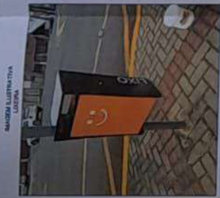
MADEIRA ALTERNATIVA LATERAL