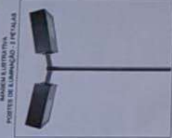
PORTES DE ILUMINAÇÃO - TETALAS